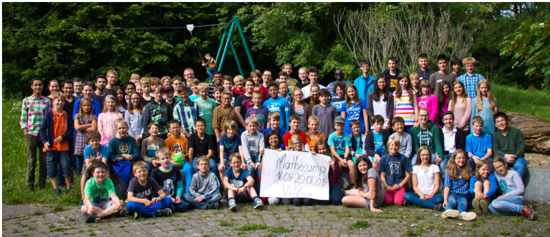
Schülerinnen und Schüler des ersten Mathecamp vor zwei Jahren.