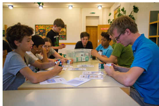
Spiel und Spaß mit dynamischen Labyrinthen, mathematischen Zaubertricks, Zahlenfolgen und dem Zauberwürfel.